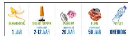
Nb: plastic verbrokkelt, maar het verteert nooit.

De tijd dat het duurt voordat er niets meer terug te vinden is van een stuk zwerfvuil hangt erg af van het materiaal waarvan het gemaakt is. Hieronder staat een plaatje met afbraaktijden voor een aantal veel voorkomende soorten zwerfafval.