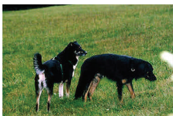
Lichaam wegdraaien (hond rechts)