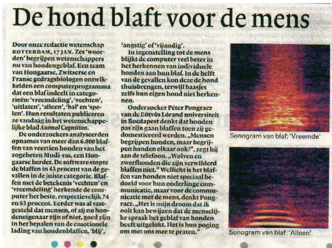
Figuur 1: artikel NRC