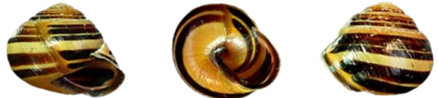
Cepaea nemoralis (gewone tuinslak)

Heeft gewoonlijk een donkere lip. Volwassen slakken kunnen soms slechts 17 mm breed zijn, maar meestal tussen de 20 en 24 mm. Heel soms zijn ze zelfs nog groter, meer dan 26 mm..