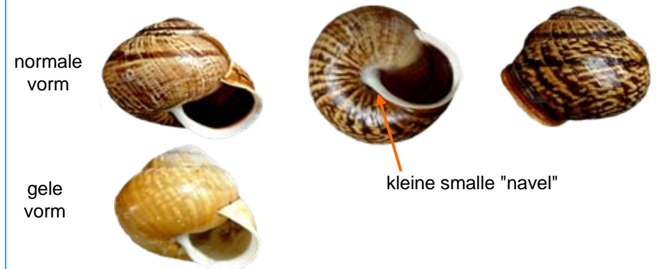
Arianta arbustorum (heesterslak)

Heeft gewoonlijk een donkere lip. Volwassen slakken kunnen soms slechts 17 mm breed zijn, maar meestal tussen de 20 en 24 mm. Heel soms zijn ze zelfs nog groter, meer dan 26 mm..