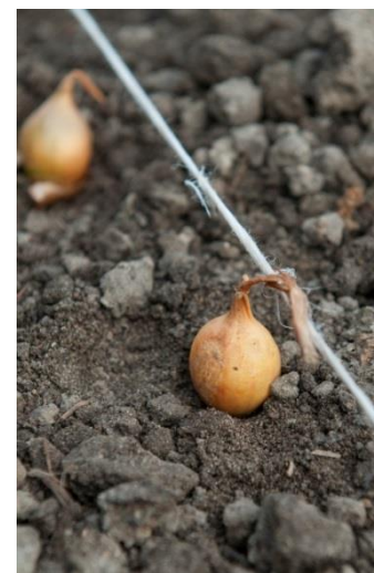
aarde er overheen