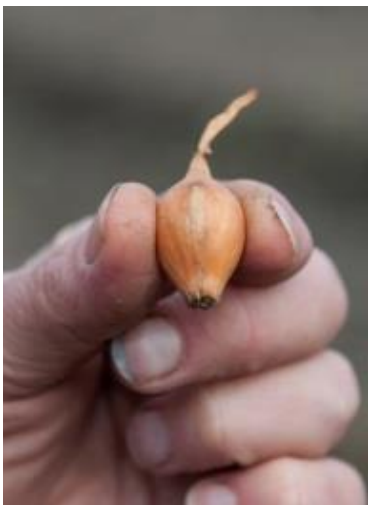
uien er in